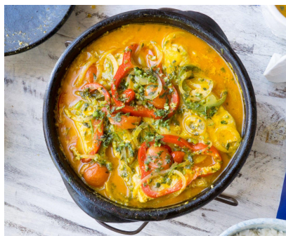
* Moqueca de peixe ou vegetariana