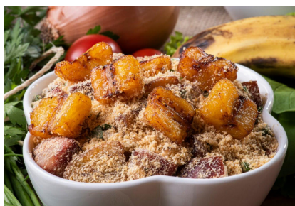
Farofa de banana