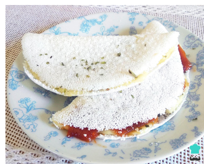
Tapioca de queijo c/ geleia de pimenta

* Podemos fazer moqueca vegetariana para parte ou todo grupo.